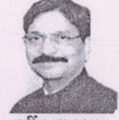
रवींद्र वायकर भा. राज्यामंत्री, उच्च व तंत्रशिक्षण