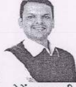
देवेंद्र फडणवीस भा. मुख्यमंत्री