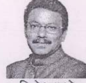
विनोद तावडे भा. मंत्री, उच्च व तंत्रशिक्षण