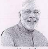
नरेंद्र मोदी भा. पंतप्रधान